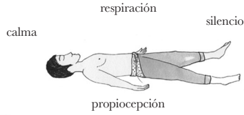
J. Tiempo de integración